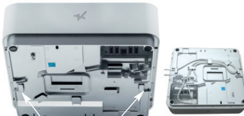
Options de sortie de câble